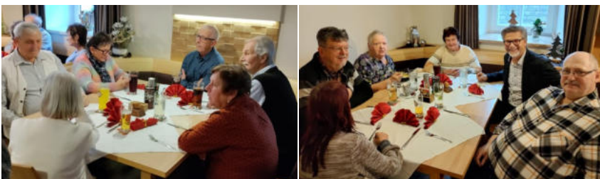
Fotos SPÖ-Dimbach: Pensionistenverband Weihnachtsfeier im GH Samböck

Auf diesem Weg möchten wir uns beim gesamten Pensionistenverband für das wunderbare Miteinander im vergangenen Jahr bedanken. Wir wünschen allen frohe Weihnachten sowie ein glückliches und gesundes neues Jahr 2026!